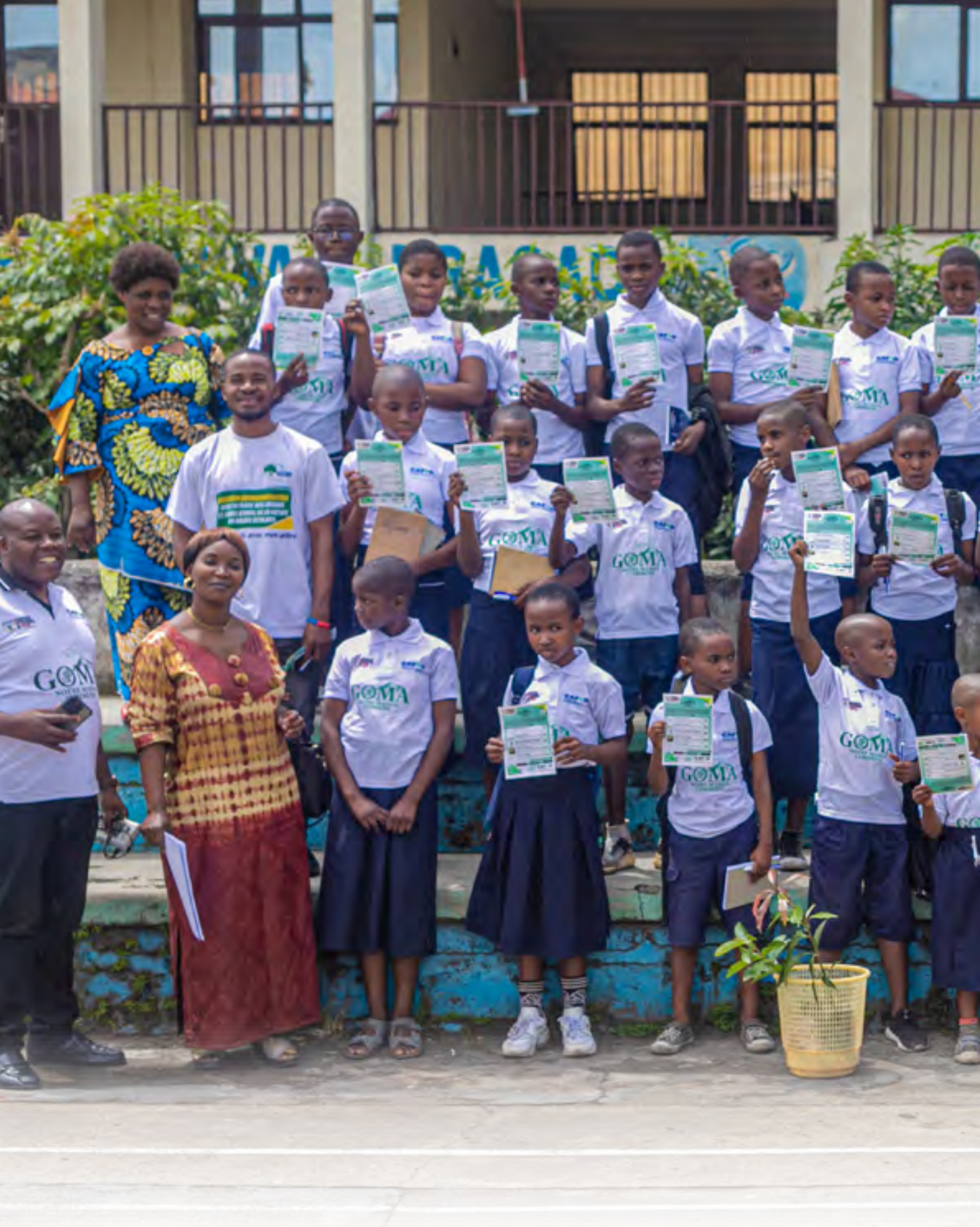
Photo des écoliers après la formation sur l'Eco-citoyenneté dans le cadre du projet « Goma Notre Maison Commune ».