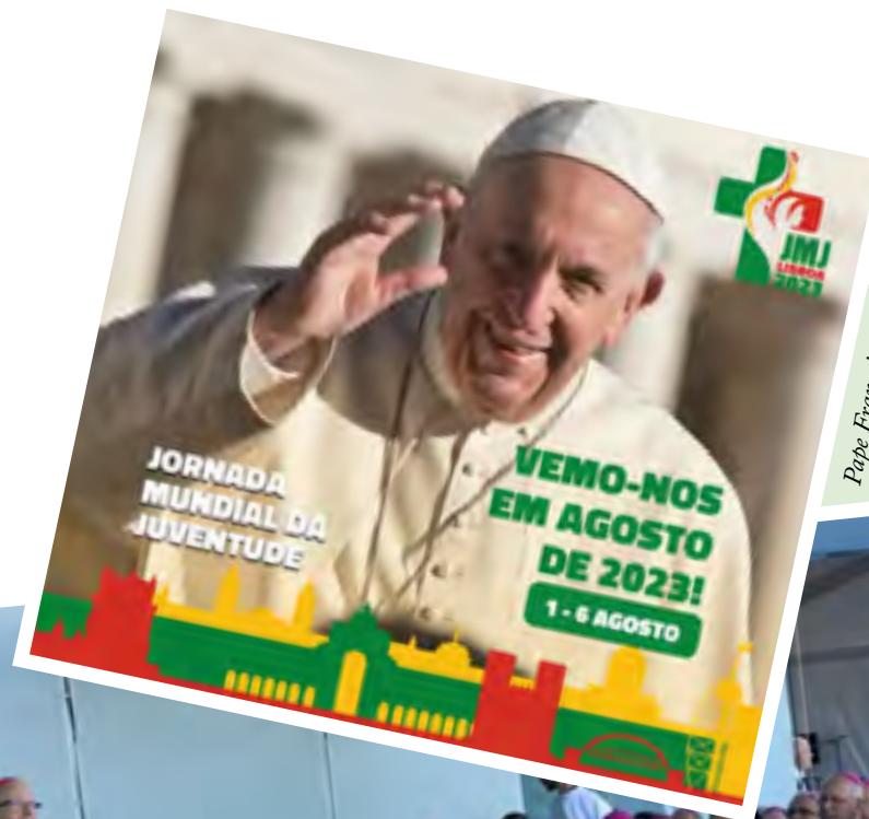
Pape François aux jeunes étudiants universitaires

Une tradition médiévale raconte que lorsque les pèlerins du chemin de Saint Jacques se croisaient, l'un saluait l'autre en s'exclamant « Ultraia » et l'autre répondait « et Suseia ». Ce sont des expressions d'encouragement à continuer la recherche et le risque du chemin, en se disant : « Va plus loin, plus haut ; allons, courage, va plus loin ». C'est ce que je vous souhaite de tout cœur.